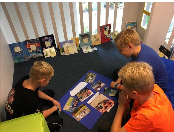
De nieuwe leerlingenraad in actie met het selecteren van goede ideeën en het kiezen van de mooiste 'zomerleesfoto'.