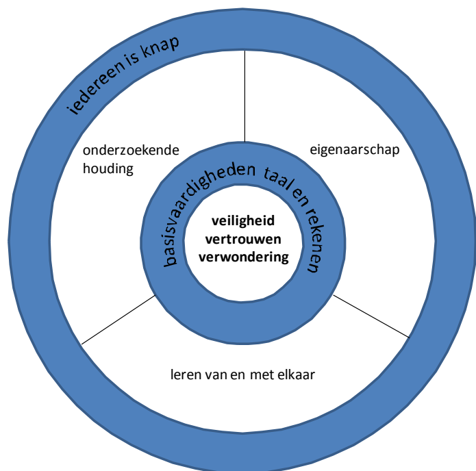
Broedplaats voor talent

Samen creëren wij een duurzame, toekomstgerichte broedplaats voor talent.