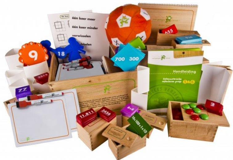
Figuur 5: Materialen Met sprongen vooruit groep 5/6

Het automatiseren in de onderbouw blijft veel aandacht krijgen. De aangeleerde tafels worden elk schooljaar verder geautomatiseerd. Dit is nodig om de rekenstof in de bovenbouw vlot en handig te kunnen verwerken.