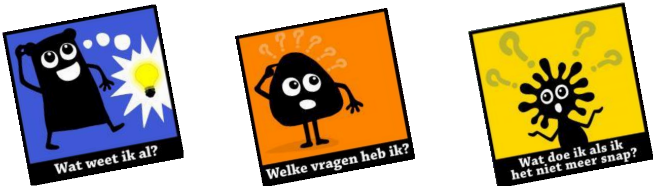
Figuur 3: Enkele leesstrategieën

Op die manier zorgen we voor een mooie doorgaande ontwikkelingslijn voor de kinderen in alle groepen.