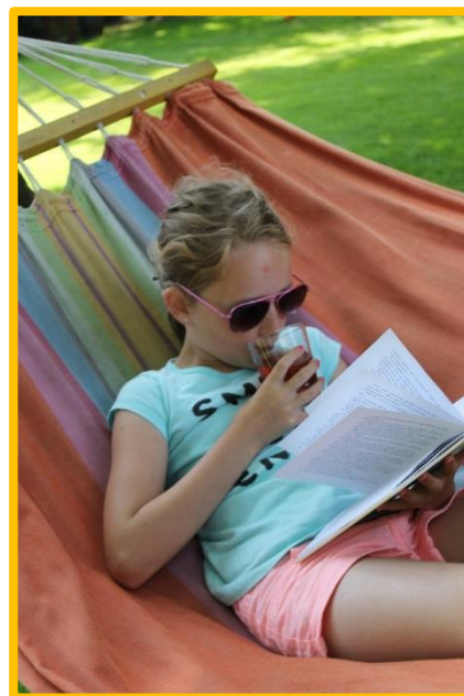
Winnaar voorgaande editie

Als katholieke school vinden we het belangrijk om samen te vieren. We willen net als andere jaren graag ook nu stil te staan bij een nieuw schooljaar. Daarom houdt de school op dinsdag 6 september een openingsviering in de kerk om 08.45 uur m.m.v. pastoor Hermens . We nodigen u hiervoor van harte uit. Het thema voor de viering is: Een duurzaam begin!